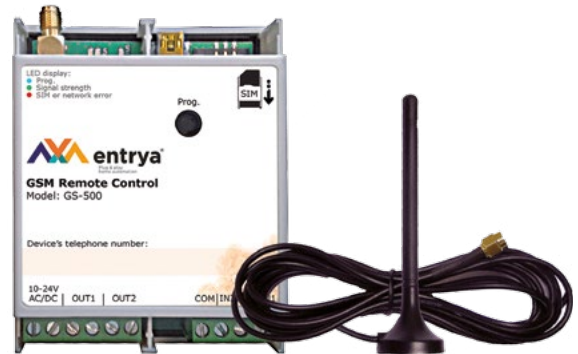
GSM module en antenne

Alle oproepen naar uw GS-500 zijn gratis want de module weigert alle oproepen. U kunt het toestel laten terugbellen om een actie te bevestigen. Gaat u veelvuldig gebruik maken van deze controlefunctie, dan raden wij aan om voor een abonnement te kiezen.