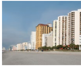
Toegang tot vakantiewoning