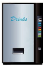
Ter vervanging van muntjes